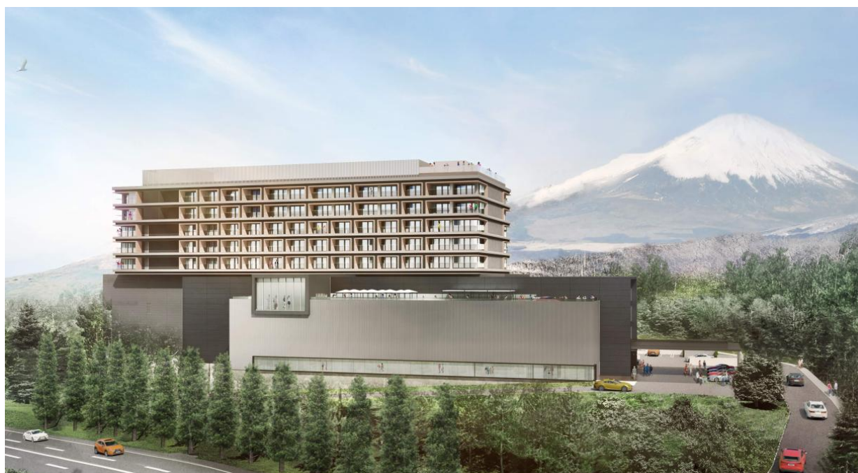
FUJI Speedway HOTEL外観 (手前にFUJI MOTORSPORTS MUSEUM併設)