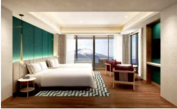
富士スピードウェイホテル 客室