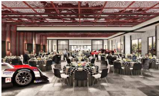
富士スピードウェイホテル 宴会場