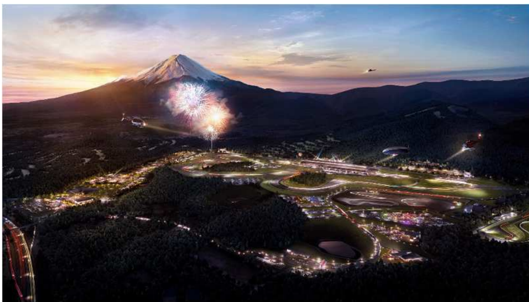
夕焼けに染まる富士山と「富士モータースポーツフォレスト」 (左側が新東名高速・(仮称)小山PA) ※イメージパース

国際サーキット「富士スピードウェイ」を中心に、ラグジュアリーエクスペリエンスを提供する「富士スピードウェイホテル」、時代を象徴するレーシングカーを展示する「富士モータースポーツミュージアム」、国内有数のレーシングチームのガレージ、より多くの方に立ち寄っていただける温浴施設、レストランなど、モータースポーツ文化を楽しめる多彩な施設から構成されます。