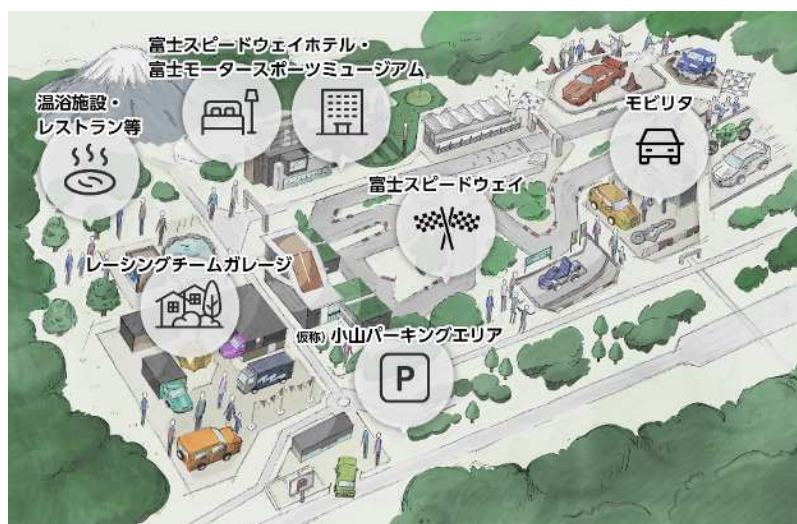
富士モータースポーツフォレスト 俯瞰図イラスト