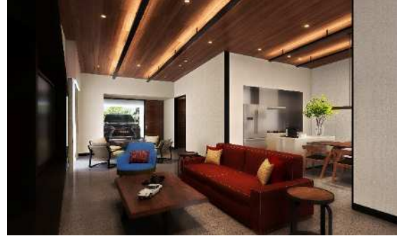
富士スピードウェイホテル 客室（ヴィラ）