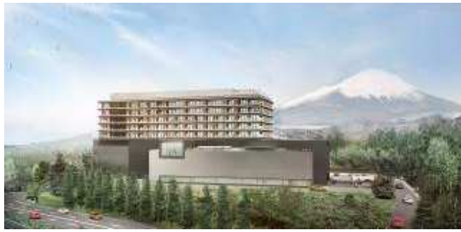
富士スピードウェイホテル 外観