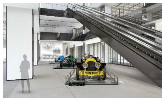
富士モータースポーツミュージアム 展示風景