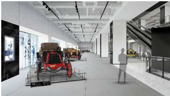
富士モータースポーツミュージアム 展示風景