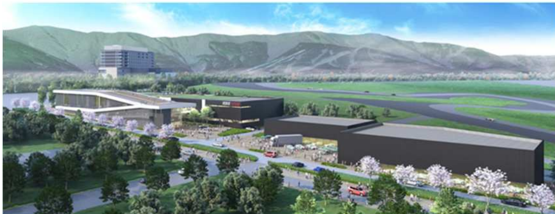
レーシングチームのガレージが集まるエリア